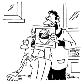
“Я называю это “ФНС”. Немного по бокам и сзади и наголо сверху!”.

Девушка налоговый инспектор после декларационной кампании листает толстые папки, где находятся декларации о доходах. - Вот это то, что мне нужно! - воскликнула она. - двадцать восемь лет. Холост. Никого на иждивении и доход 10 млн. в год.