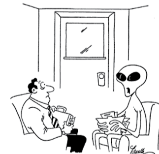
“Да, конечно, Правительство отрицает наше существование... пока не придет время платить налоги”.