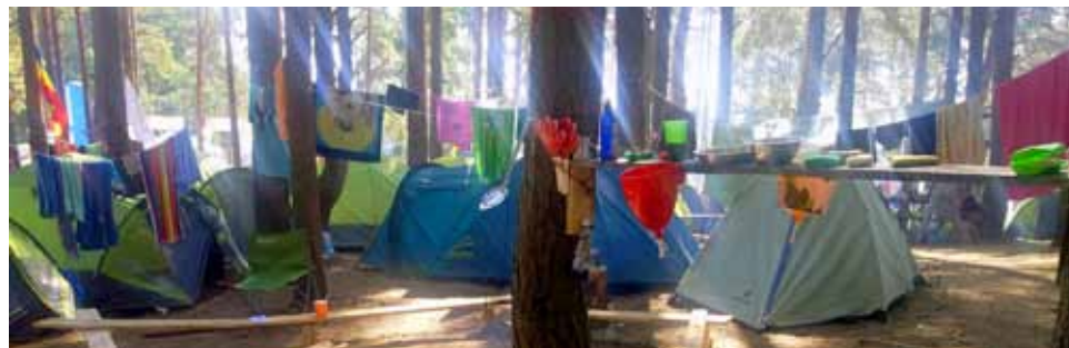
В палаточном лагере минуты редкого затишья: 6 утра.

Самое главное, что мне понравилось на форуме — это единый общий дух молодежи, готовность каждого помочь другу. Там не только другое измерение, но и совершенно другое государство. Встретившись с кем-нибудь взглядом, непременно увидишь улыбку, лю-