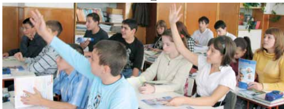
Ученики активно участвуют в лекции.

Под эгидой ПФР 15 октября по всей России прошел единый день пенсионной грамотности. Участвовали в нем и органы пенсионного фонда Ставропольского края.