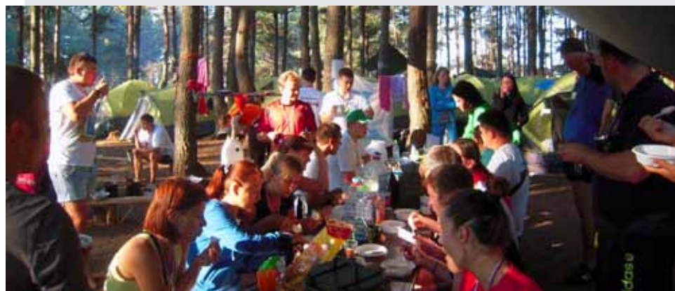
Участники форума на завтраке: все по-походному.

бой человек может заговорить с тобой, как с хорошо знакомым, всегда протянет руку помощи, а если надо — подставит дружеское плечо в качестве подушки на лекции (такое все-таки случалось). Наше человеколюбие прошло квалифицированную проверку: на одном из занятий всех участников разделили на 3 группы. Каждому достался листочек с указанной профессией.