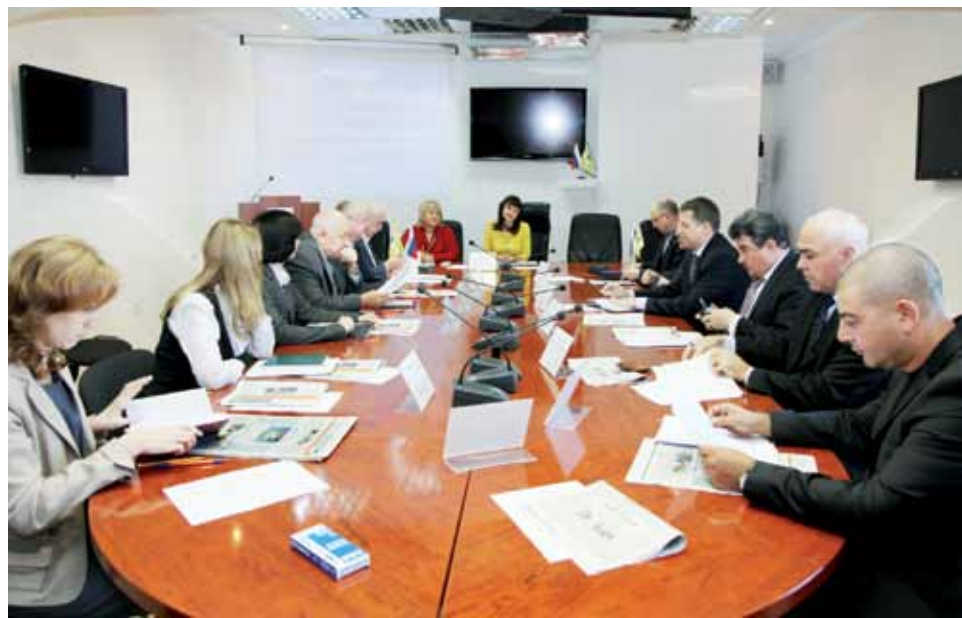
Налоговики стремятся найти комплексный подход к повышению уровня открытости, привлекая к работе совета общественные организации, журналистов, ученых, предпринимателей.

Члены совета подвели итоги проделанной работы и обменялись мнениями по поводу перспективных направлений деятельности. Результатом первого заседания стала разработка методических материалов по запросам общественных организаций. Вопросы, решаемые в рамках информационного обмена, касались таких сфер деятельности, как использование телекоммуникационных каналов связи для представления отчетности и соблюдение законодательства при представлении отчетности через уполномоченного представителя. Взаимодействие с общественными организациями также проходило в рамках информирования предпринимателей о применении концепции планирования выездных налоговых проверок. Существует методика самостоятельной оценки налоговых рисков, она общедоступна, но не все об этом знают. Совместно с Торгово-промышленной палатой, краевым отделением организации «ОПОРА России» и Конгрессом деловых кругов Ставрополья была организована информационная работа в предпринимательском сообществе края.