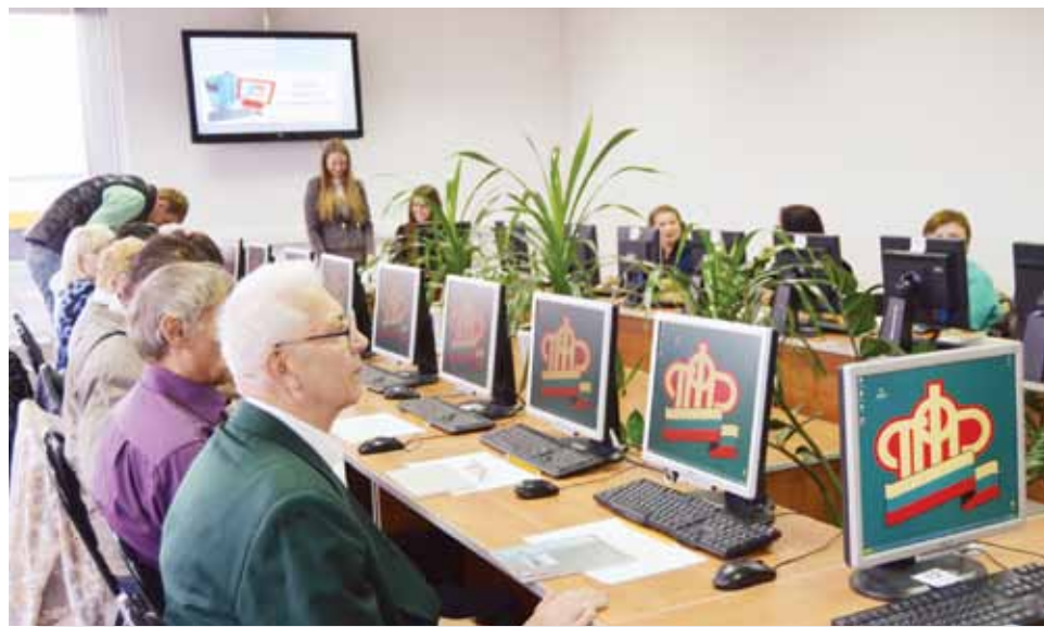
Пенсионеры исправно посещают занятия.

В рамках соглашения было разработано специализированное образователь-