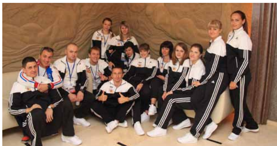
Команда ставропольцев вошла в состав сборной налоговых органов СКФО.