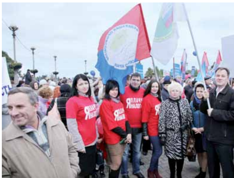
Участники митинга на Крепостной горе Ставрополя.

7 октября 2014 года в рамках Всемирного дня действий «За достойный труд», ежегодно отмечаемого в мире по призыву Международной конфедерации профсоюзов с целью привлечения внимания к проблемам работников, Федерация независимых профсоюзов России провела общероссийскую акцию профсоюзов под главным лозунгом: «За достойный труд без войн и санкций!». Главным ее событием в Ставрополье стал митинг Федерации профсоюзов СК на Крепостной горе краевого центра, куда, несмотря на пронизывающий ветер, собралось более 3000 представителей профсоюзных структур и молодых профактивистов со всего края.