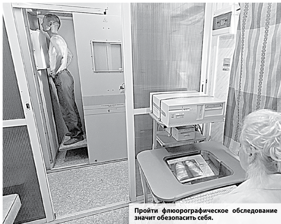
Пройти флюорографическое обследование значит обезопасить себя.

За последние десять лет смертность от туберкулеза в Астраханской области снизилась почти вдвое. Тем не менее она более чем вдвое превышает российский показатель. Палочку Коха считают миной замедленного действия. Заразиться туберкулезом может каждый человек, поэтому особое значение имеет профилактика и раннее выявление заболевания.