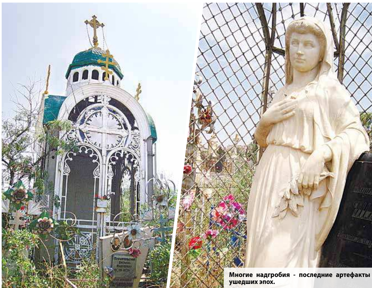
Многие надгробия - последние артефакты ушедших эпох.