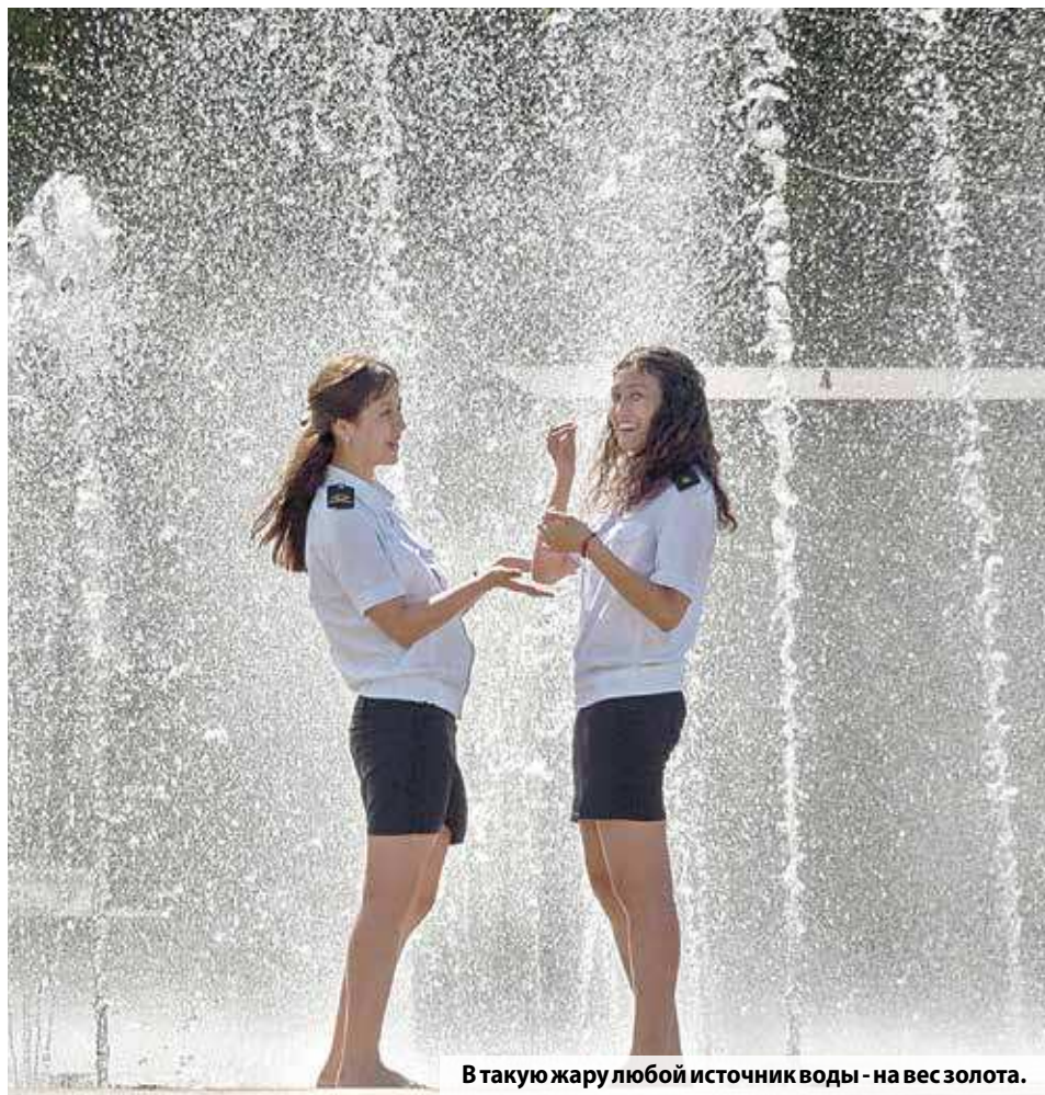
В такую жару любой источник воды - на вес золота.