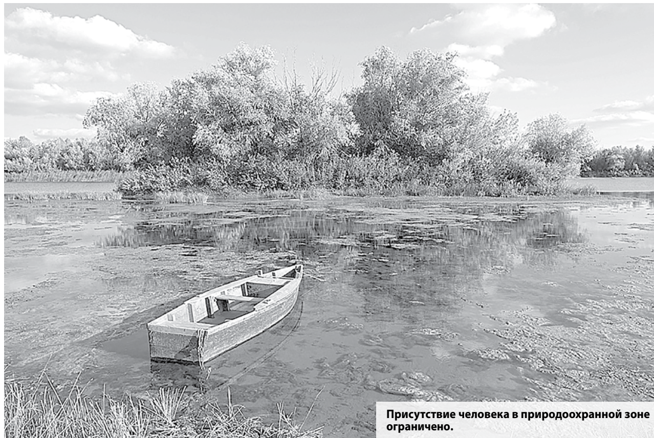
Присутствие человека в природоохранной зоне ограничено.