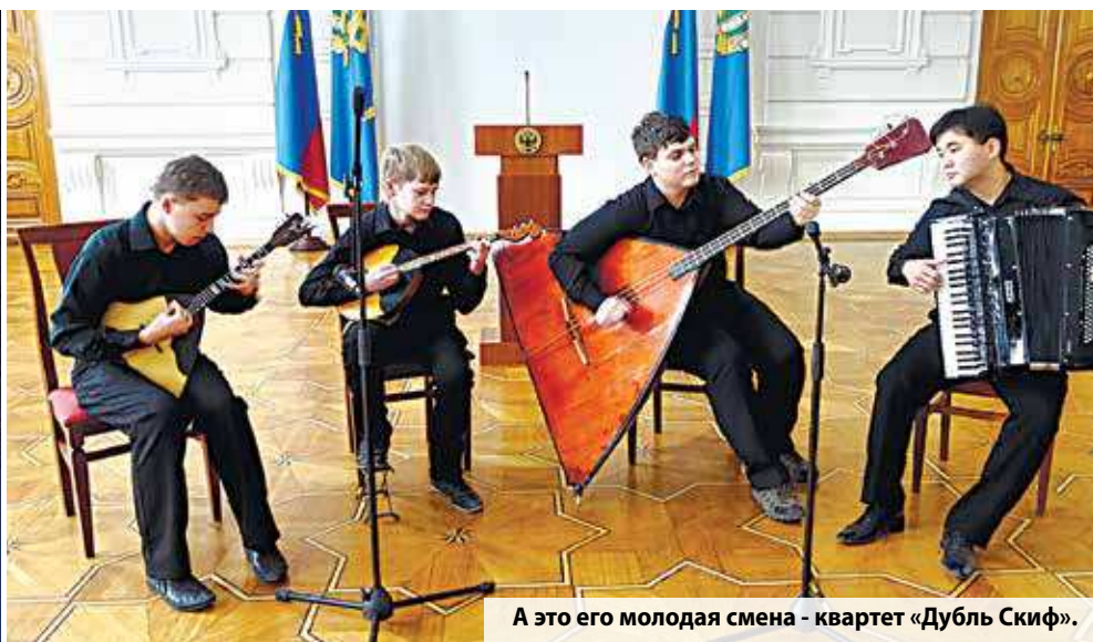
А это его молодая смена - квартет «Дубль Скиф».