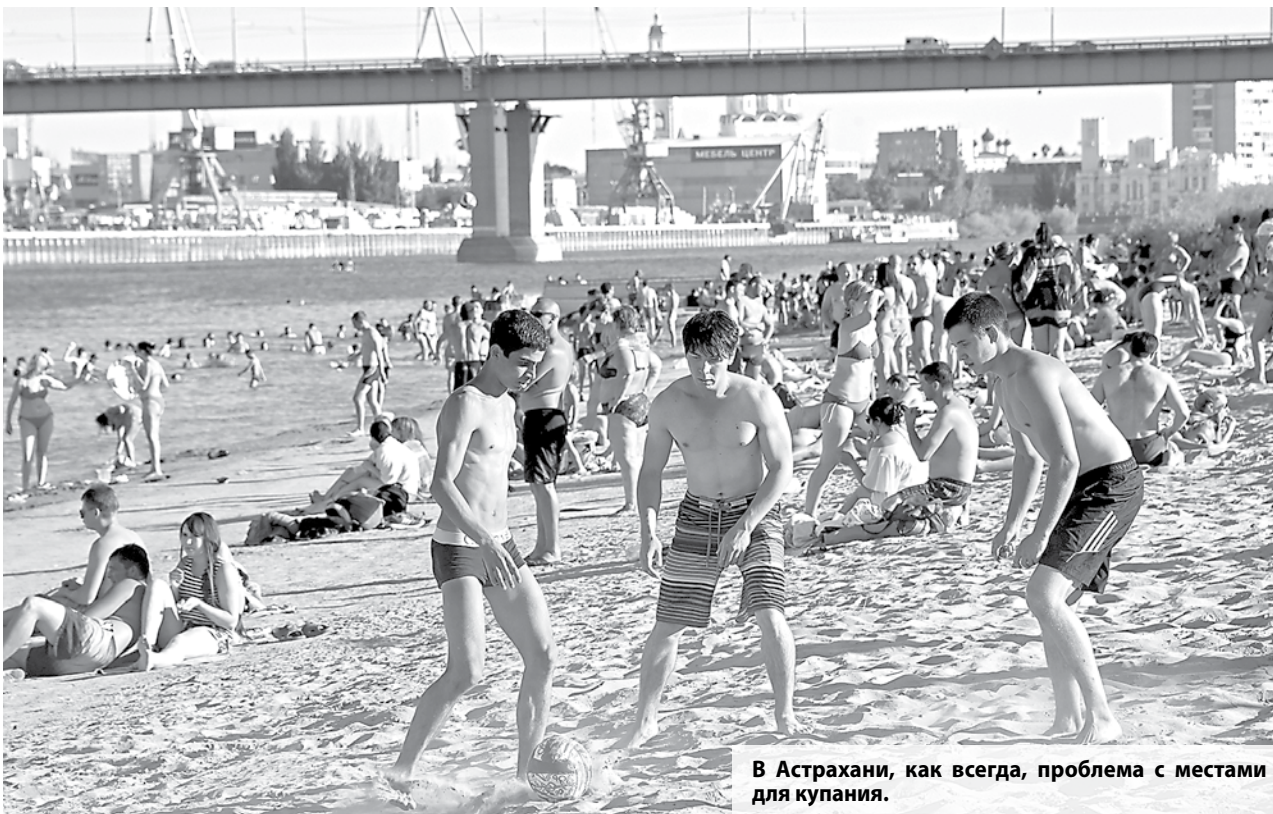
В Астрахани, как всегда, проблема с местами для купания.