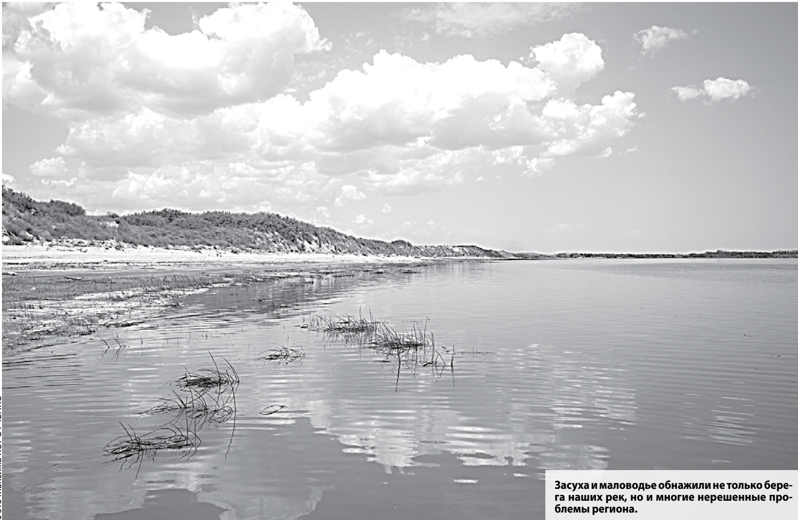
Засуха и маловодье обнажили не только берега наших рек, но и многие нерешенные проблемы региона.