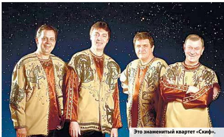
Это знаменитый квартет «Скиф».