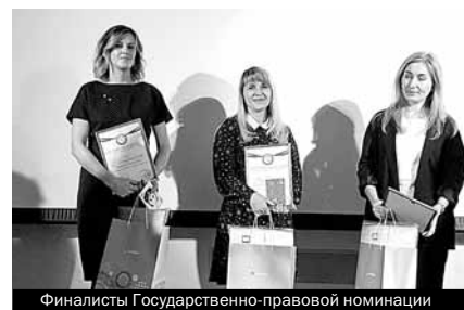
Финалисты Государственно-правовой номинации