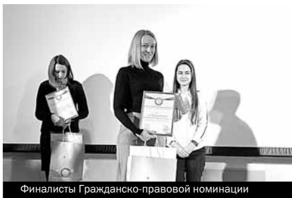
Финалисты Гражданско-правовой номинации