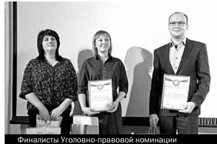
Финалисты Уголовно-правовой номинации

Все участники второго тура получили дипломы и памятные подарки от организаторов конкурса на своих рабочих местах ко Дню юриста.