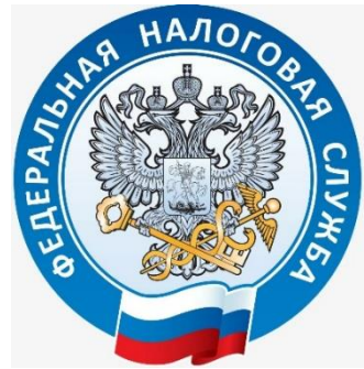
УФНС России по Пермскому краю