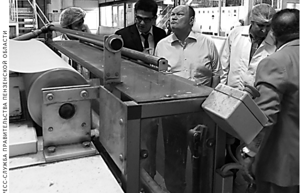
В ходе визита в Турцию пензенская делегация посетила местный индустриальный парк.